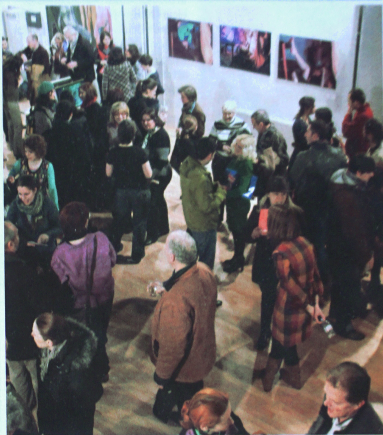
Vernisajul expoziției Idila